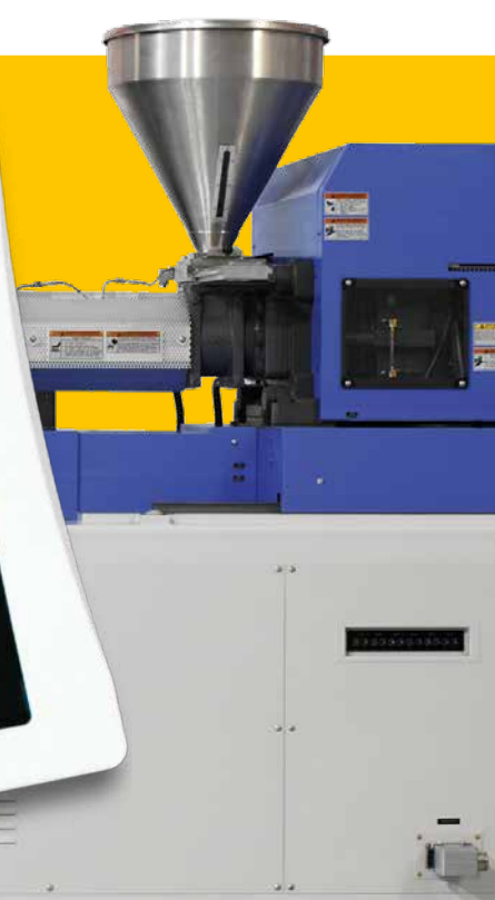
Unidad de datos con pantalla táctil de 7"