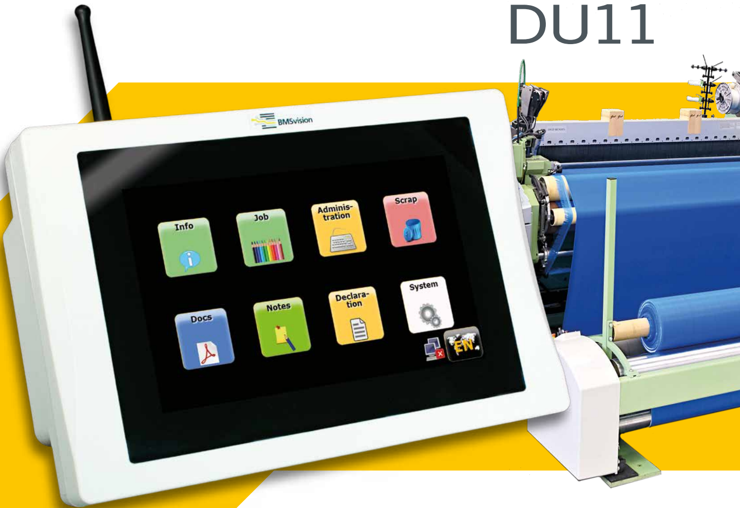
Unidad de datos con pantalla táctil de 7"