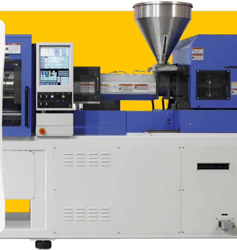
Data Unit avec écran tactile 5"